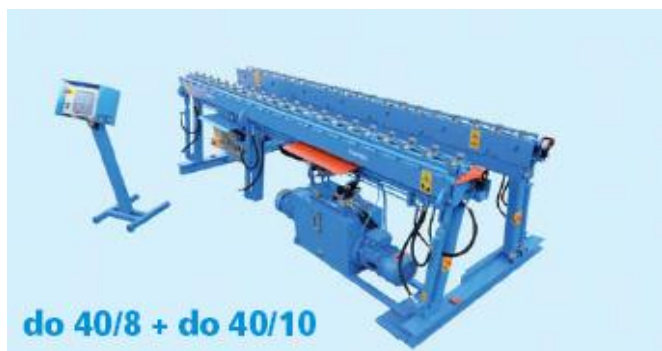
do 40/8 + do 40/10

Szerokość robocza 2,50 - 6,00 m Dla prętów do max. \varnothing 8 mm