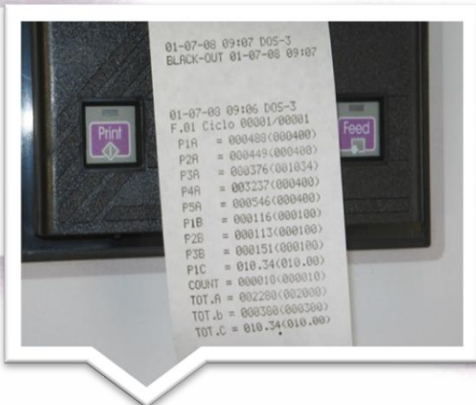
Drukarka z wydrukiem zarobu