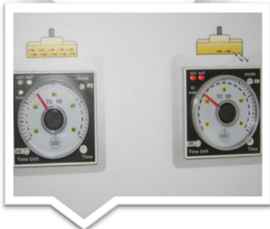
Zegary do ustawiania wartości czasowych mieszania i rozładunku masy betonowej