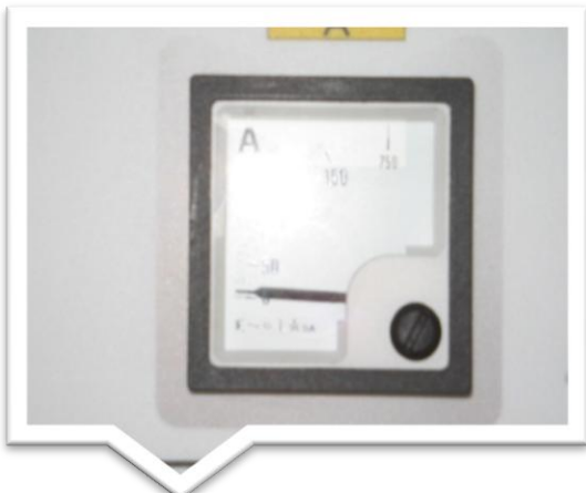
Amperomierz służący do określania konsystencji mieszanki betonowej