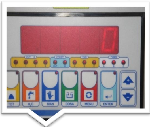
Elektroniczny programator służący do ustawiania wartości wagowych kruszyw