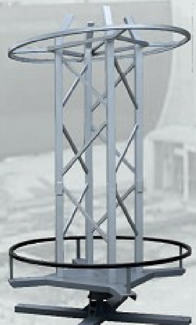
Szpula z rozwijarką