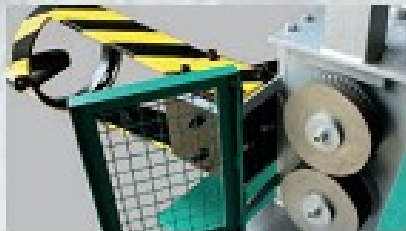
Rolki ciągnące przednie