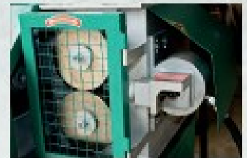
Rolki ciągnące tylne