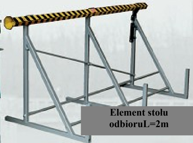
Element stołu odbioru L=2m